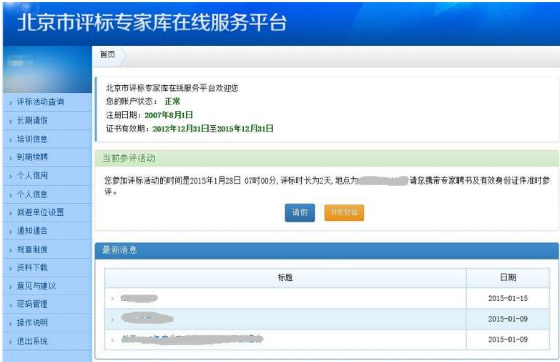
图：有当前评标活动专家的登录默认页

(3) 评标活动请假： 在评标前一工作日确定因故不能正常参加该评标活动，可点击【请假】按钮进行请假。在评标当日确定因故不能正常参加该评标活动，请拨打评标专家库咨询电话 55591325，报本人身份证号码（或北京市评标专家聘书编号）、姓名，并告知无法正常参评原因，由评标专家库运维人员记录缺席情况。电话告知时间早于评标开始时间的，记录为“事先缺席”；电话告知时间晚于评标开始时间的，记录为“无故缺席”。市人力社保部门将会同监督部门酌情处理缺席情况。