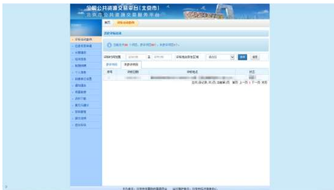
图：评标活动查询界面