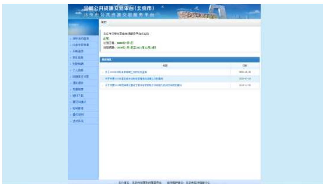
图：评标专家服务界面