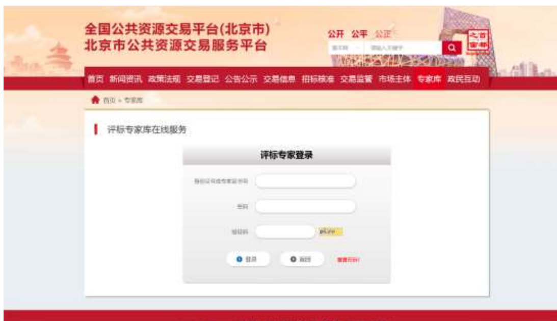
图：评标专家登录界面